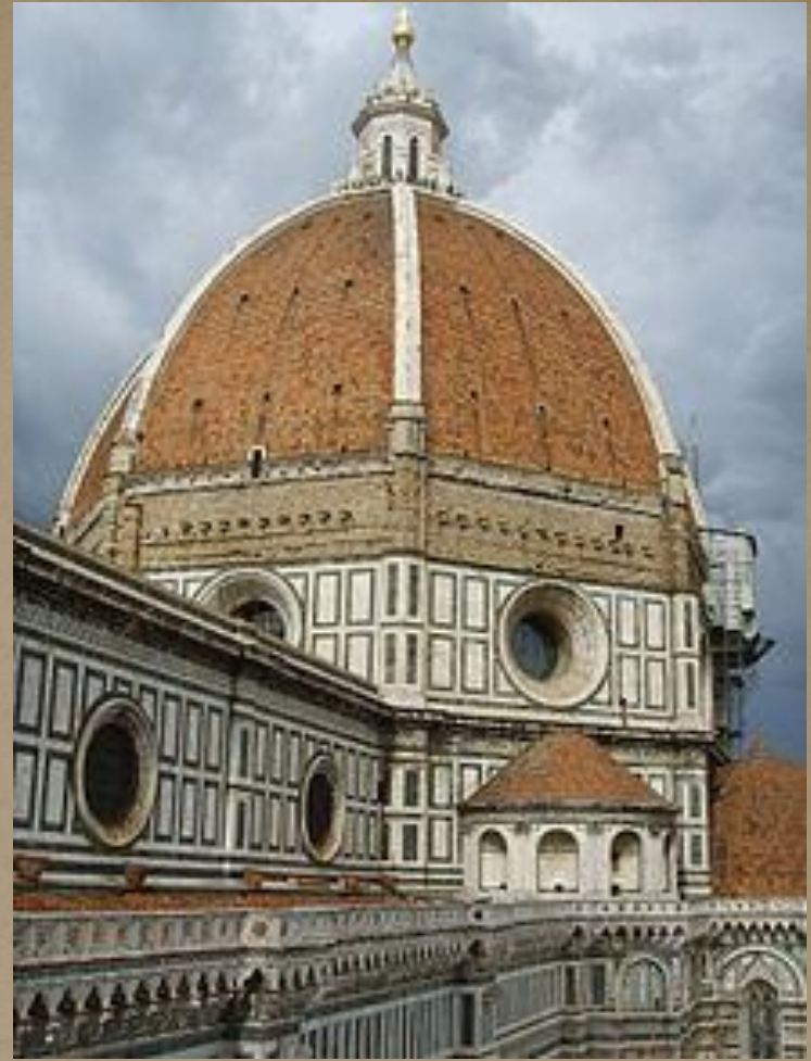
BRUNELLESCHIJEVA KUPOLA KATEDRALE U FIRENCI, 1417.