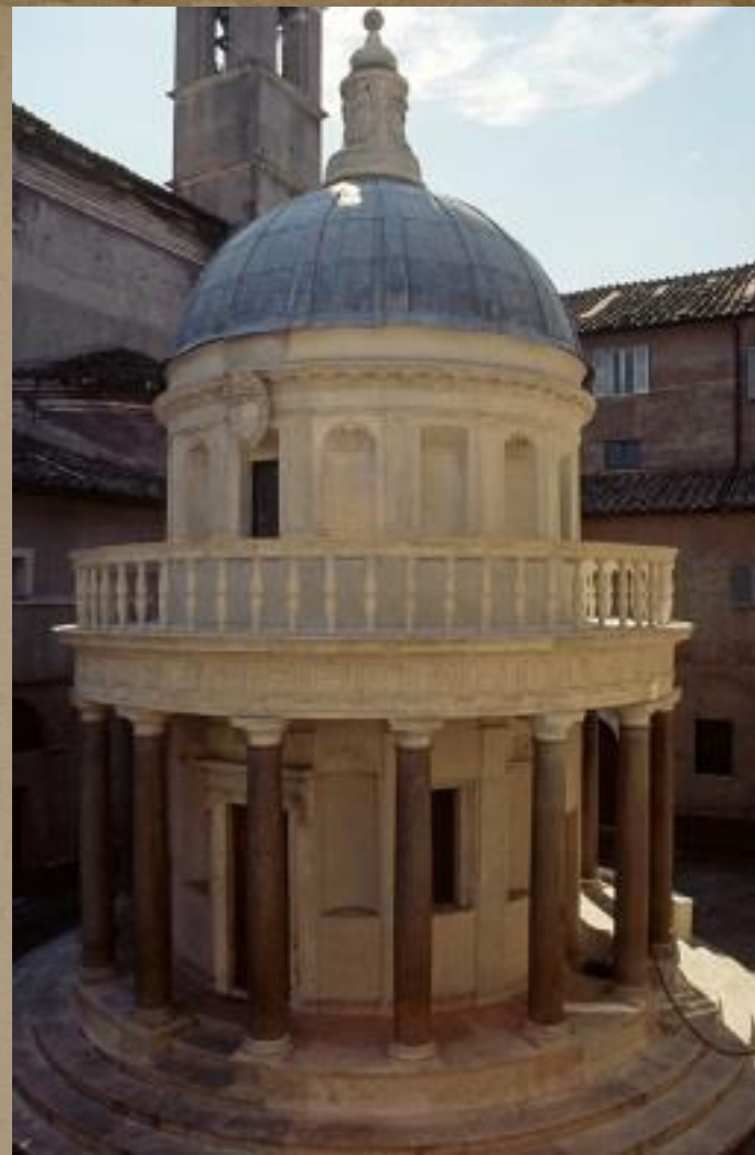
Mali hram u Rimu