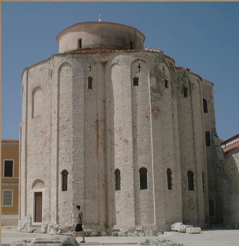
Crkva sv. Donata u Zadru