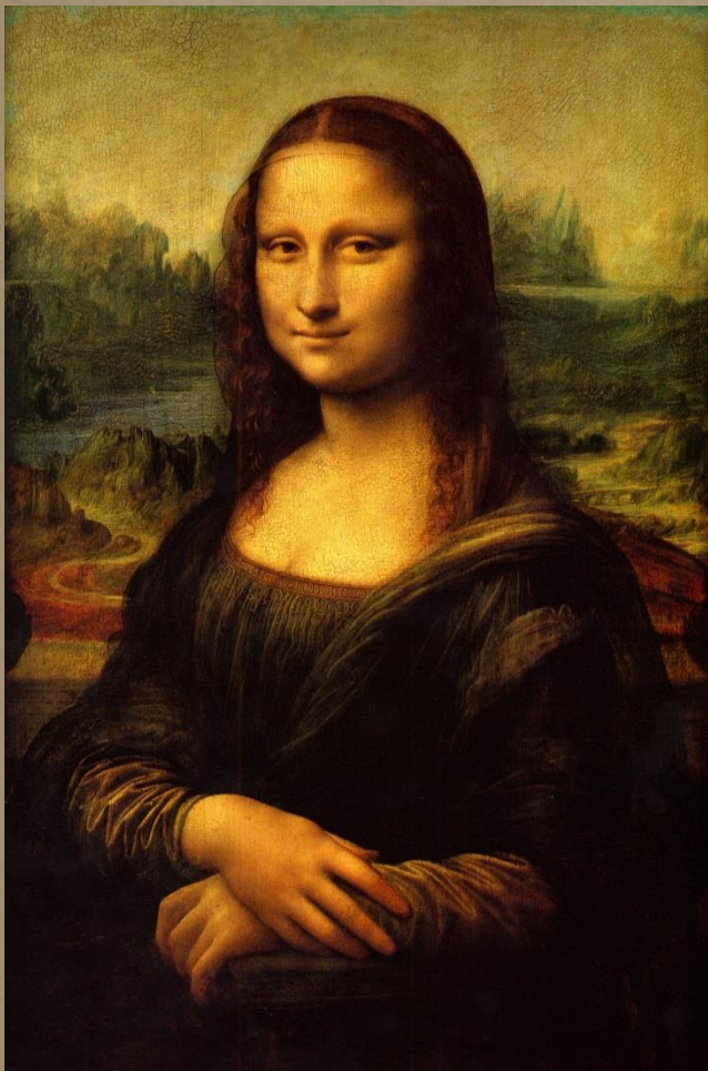
MONA LISA, LEONARDO DA VINCI, 1503.