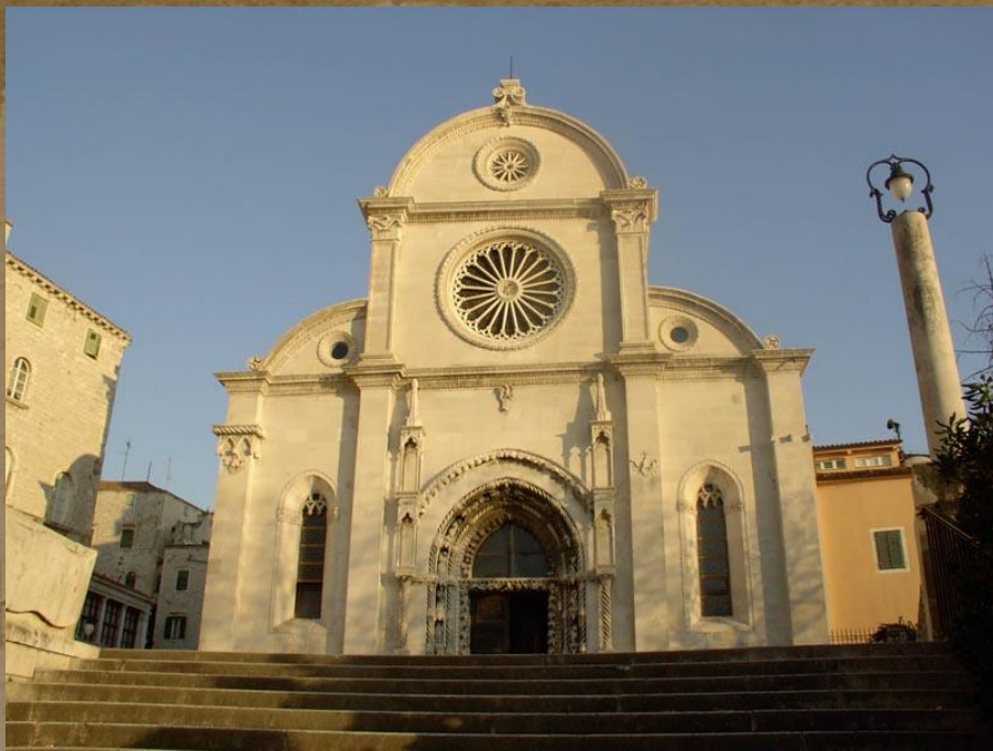
KATEDRALA SV. JAKOVA, ŠIBENIK